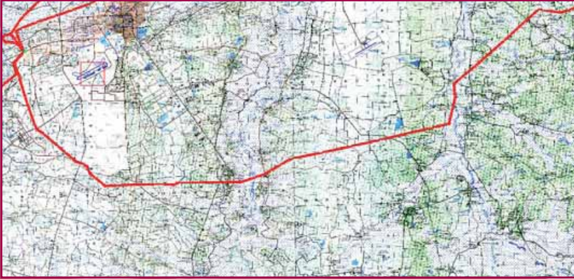
Рис. 1. Топографическая карта района с трассой ЛЭП