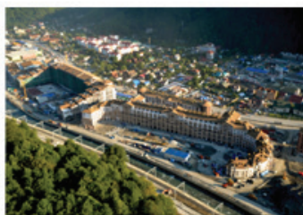
2. Олимпийская медиадеревня на отметке +520 м