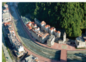
3. Нижняя база "Роза Хутор"