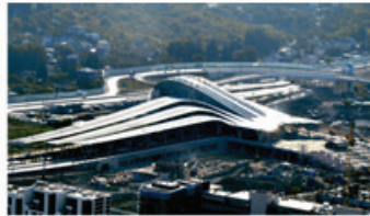
Ж/д станция Олимпийский парк