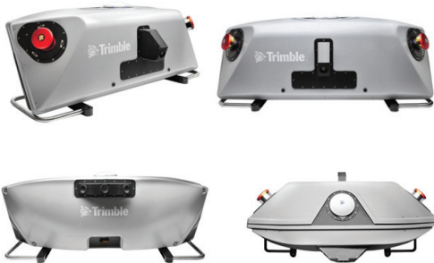
Рис. Внешний вид лазера

Съемка может выполняться с наземного, водного, буксируемого носителя или подъемного крана в непрерывном режиме.