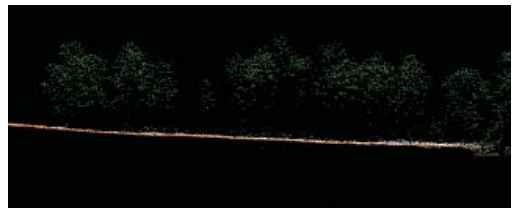
Рис. 3. Профиль (по красной линии на рис. 2). Хорошо видно различие крон каждого дерева и поверхность рельефа под кронами

Кроме воздушного лазерного сканирования, ни один из применяющихся на сегодняшний день методов ДЗЗ не обладает одновременной возможностью получать и видимую поверхность крон, и поверхность рельефа. Действительно, оптико-электронное наблюдение дает нам информацию о видимой поверхности (кроны), оставляя рельеф невидимым. Радарная съемка —