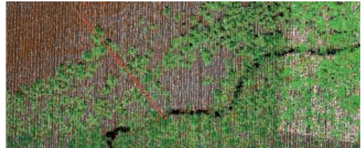
Рис. 2. Пример лазерного сканирования леса с плотностью 4 точки/м 2 . Красная линия – ось профиля (рис. 3)

масштаб 1:1000) легко различимы в 3Д-режиме (т. е. просто по форме, без спектральных признаков) кроны лиственных и хвойных деревьев с учетом наиболее высоких точек дерева. Даже данные с плотностью 2 точки на 1 кв. м (под масштаб 1:2000, рис. 2, 3) неплохо подходят для использования при обновлении материалов лесоустройства всех категорий таксации. Данные под масштаб 1:5000 (0,5–1,0 точки на 1 кв. м) идеальны для использования при уточнении результатов, полученных по моделям хода роста.