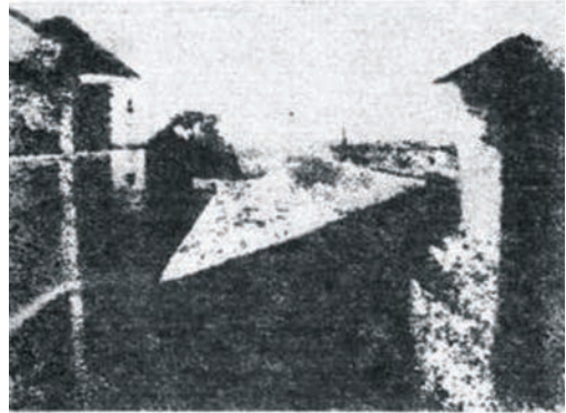
Рис. 1. Гелиографический снимок Ньепса

В 1839 г. Дагер и Ньепс представили общественности «дагерротипию» – изобретение, позволявшее выполнить съемку с получением одного позитивного изображения. В качестве фотоматериала использовали посеребренную медную пластинку, обработанную парами йода, в результате чего образовывался тончайший слой светочувствительного йодистого серебра.