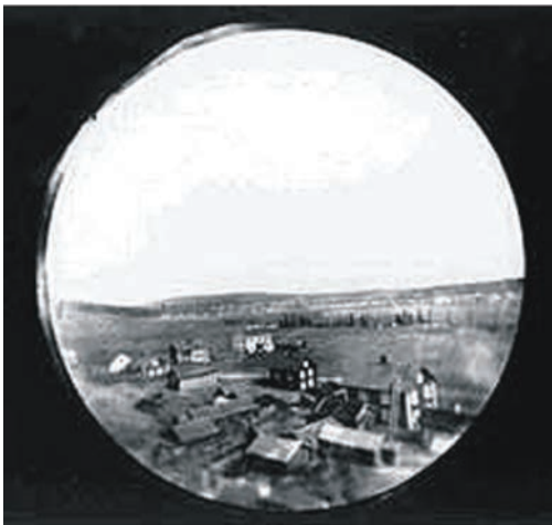
Рис. 3. Первый аэрофотоснимок земной поверхности, полученный с использованием ракеты

В 1897 г. Альфредом Нобелем был получен первый аэрофотоснимок с использованием ракеты (рис. 3).