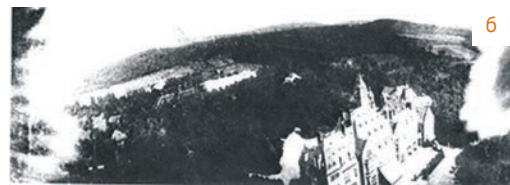
Рис. 4. «Голуби-аэрофотосъемщики» с установленным оборудованием (а) и пример аэрофотоснимка, полученного при помощи голубя (б)

В 1903–1904 гг. состоялись знаменитые полеты Уилбура и Орвилла Райт (братьев Райт). Они впервые поднялись в воздух на самолете, используя горючее топливо.