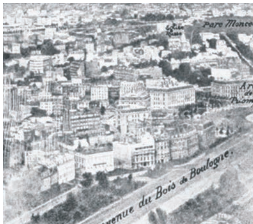
Рис. 2. Первое фотографическое изображение земной поверхности (Париж), полученное с привязного аэростата

В 1861 г. фотограф Томас Саттон вместе с Джеймсом Кларком Максвеллом продемонстрировали методы получения цветного изображения с использованием красного, синего, зеленого и лимонного светофильтров.